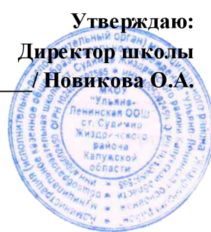
График оценочных процедур в 1-9 классах на III четверть 2023-24 уч. год